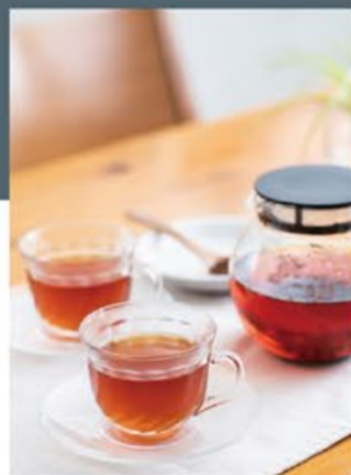
Enjoy tea party 自家製ハーブのお茶はいかが?

ライフスタイルや生活様式の変化を察して、リビングルーム の考え方が多様性を増してきた昨今の家づくり。家族が 集い、遊ぶ場所としての役割はもちろみ、部屋の一角に テレワークや学習スペースを設けたり、壁一面ホワイト ボードにしてお絵描きをしたり、家族の個性が光るリビング ルームの空間提案を各モデルハウスでご紹介します。