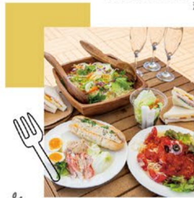
Garden dining 庭で育てた野菜で味も見た目も色とりどり!