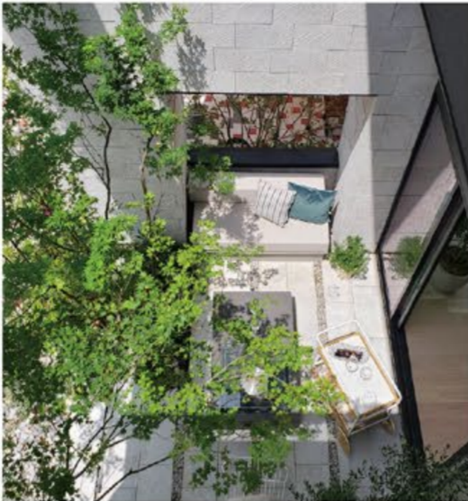
Take a look beautiful brand new houses in tvk housing plaza shinyurigaoka. By all means, please come!

We need time to relax every day. 忙しい毎日から離れて空を見上げ、 心と体を解き放つ。