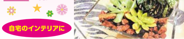
自宅のインテリアに