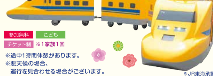
※途中1時間休憩があります。 ※悪天候の場合、運行を見合わせる場合がございます。 ※JR東海承認