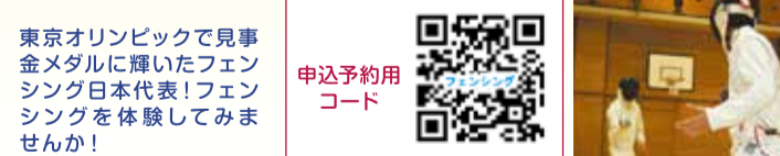
東京オリンピックで見事金メダルに輝いたフェンシング日本代表!フェンシングを体験してみませんか!