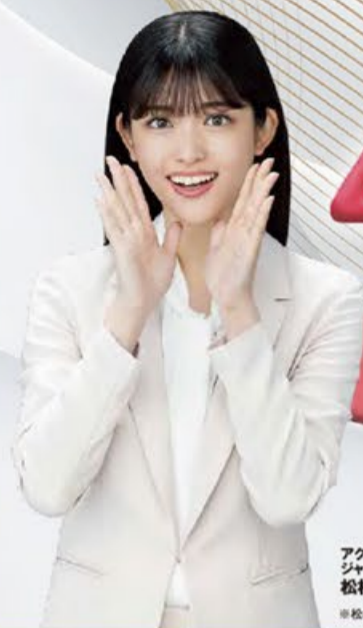
アクセル ジャパン 松村沙友理 ※松村沙友理さんは登場しません。

●お子様だけのご来場並びにイベントへのご参加はお断りさせていただきます。 ●天候や状況により、イベント内容など表記しているものに変更が生じる場合がございます。