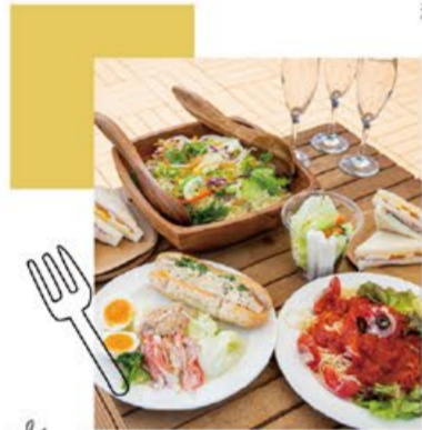
Garden dining 庭で育てた野菜で味も見た目も色とりどり!

take a look beautiful brand new houses in tvk housing plaza shinyurigaoka. by all means, please come!