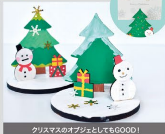
クリスマスのオブジェとしてもGOOD!

10:30~16:00 各日先着30名様 対象:小学生以下 期間中 雪だるまやプレゼントのモチーフでデコレーション! もみの木にはさめる メモクリップを作しましょう。