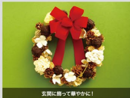
玄関に飾って華やかに!

07 SAT ①11:00~②13:00~③14:00~④15:00~ 各回先着5名様 ※各回開始30分前より整理券を配布いたします。 ※写真はイメージです。 ドライ素材の木の葉を使って Xmasリースを作しましょう。