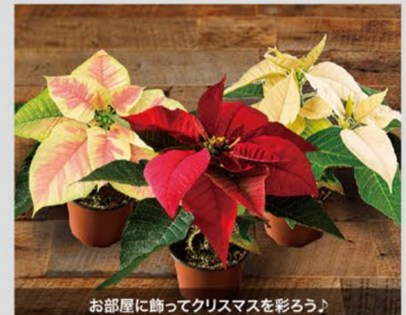
お部屋に飾ってクリスマスを彩ろう♪

10:00~17:30 各日先着20名様 期間中 ※なくなり次第終了。※期間中1家族様おひとりずつ。 ※写真はイメージです。 モデルハウスを見学してスタンプを集めた方に、 感謝を込めたお花のギフトをお贈りします。